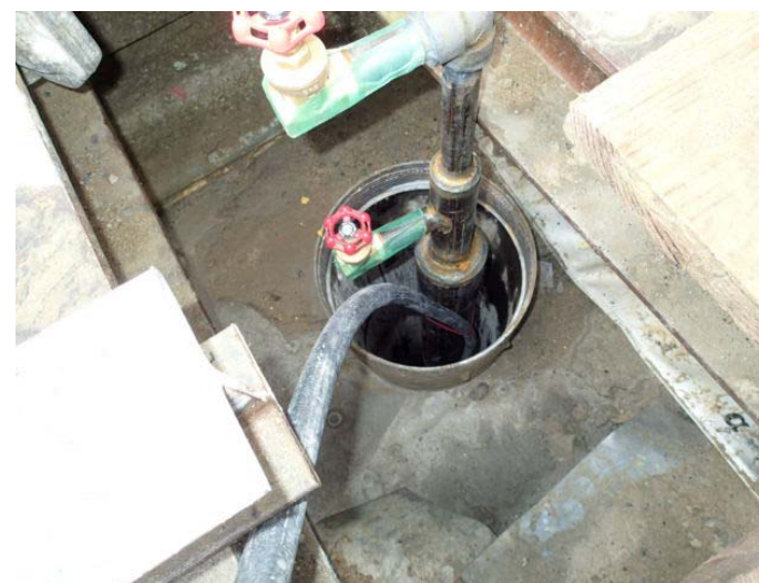
凍結管挿入完了後の状況