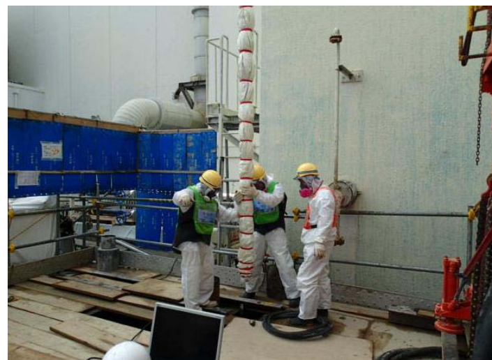
凍結管挿入作業の様子