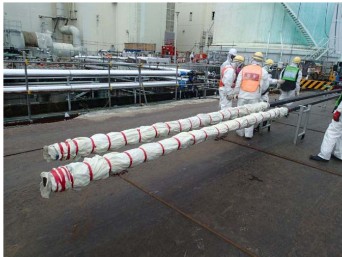
凍結管(挿入作業前)

その後、削孔作業と並行して、3月27日より、凍結管およびパッカー挿入作業を開始している。