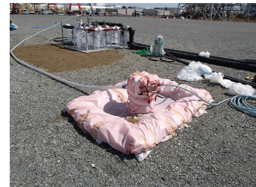
No.3貯水槽のポンプ設置状況(4/13撮影)