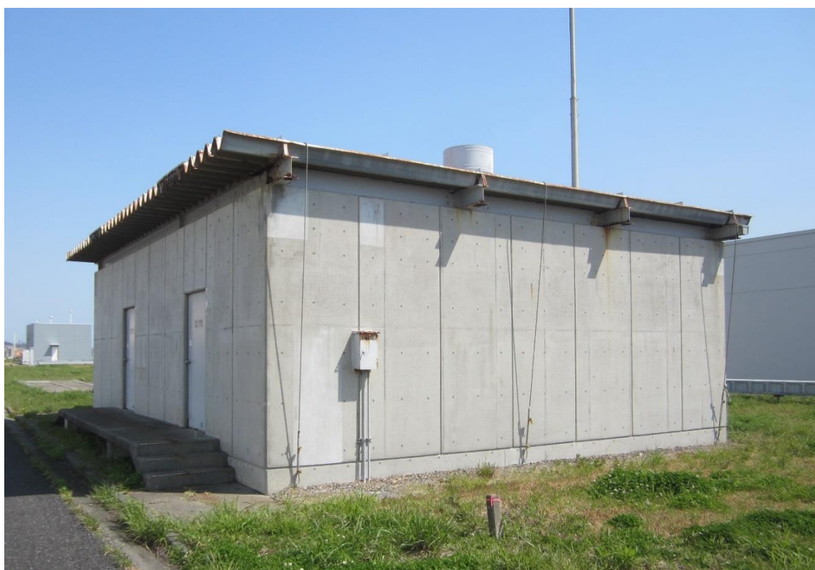
解体撤去する3,4号炉予備ポンベ建屋

*予備ポンベ建屋：発電機の冷却に使用する水素ガスポンベ等の予備を保管しておくための建屋。