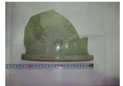
回収したプラスチック片らしきもの