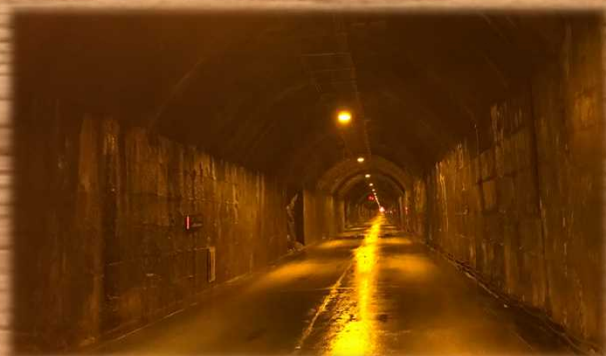
奥只見シルバーライン