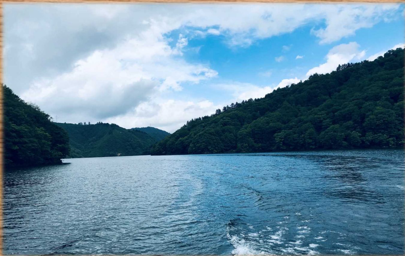
遊覧船から眺める奥只見湖