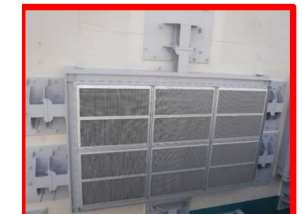
電巻防護ネット (複数箇所)

建屋の開口部に設置し、電巻により飛来した物の侵入を防止する ⇒2020年4月 工事完了