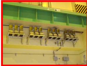
静的触媒式水素再結合装置 (PAR)

触媒の働きで、原子炉建屋に滞留した水素を酸素と再結合させ、水蒸気にする ⇒2013年9月 工事完了