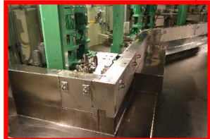
コリウムシールド

耐熱性の高い堰を設置し、溶融燃料により、鋼製の原子炉格納容器境界板の損傷を防ぐ ⇒2016年5月 工事完了