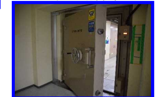
水密扉等の溢水対策 (屋内複数箇所)