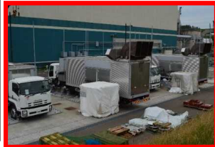
ガスタービン発電機

万が一の全交流電源喪失時にも重要機器の動力を確保する ⇒2020年11月 工事完了