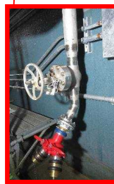
使用済燃料プールに注水するための外部接続口

重大事故発生時に外部から使用済燃料プールに注水ができるよう、消防車を接続する ⇒2015年8月 工事完了