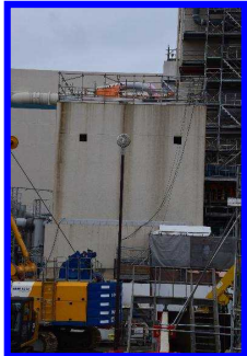
フィルタベント設備 (地上式)

放射性物質放出の影響を可能な限り低減させ、セシウム等による大規模な土壌汚染と避難の長期化を防止する