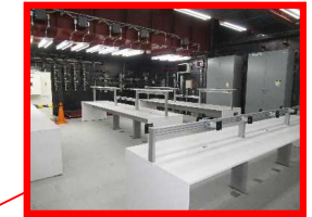
5号機原子炉建屋内緊急時対策所

重大事故等が6、7号機で発生した場合、中央制御室以外の場所から適切な指示又は連絡を行う ⇒2020年10月 工事完了