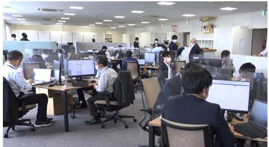
事務所での執務の様子