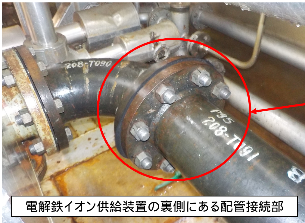
漏えい箇所(配管接続部)