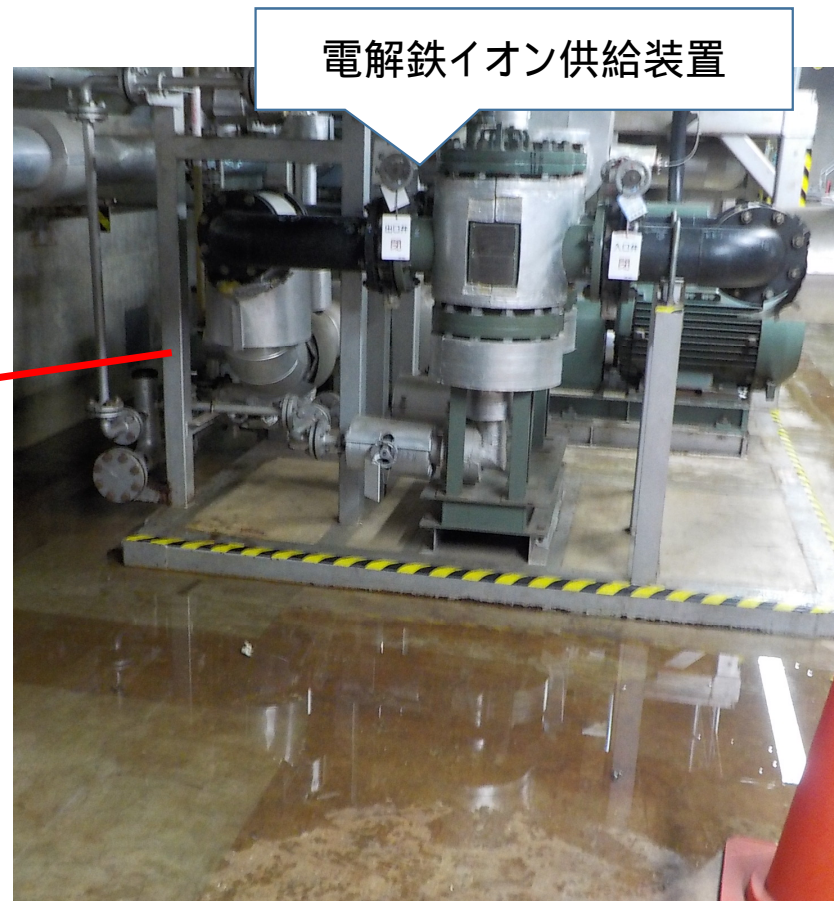
電解鉄イオン供給装置の周辺の海水漏えい状況