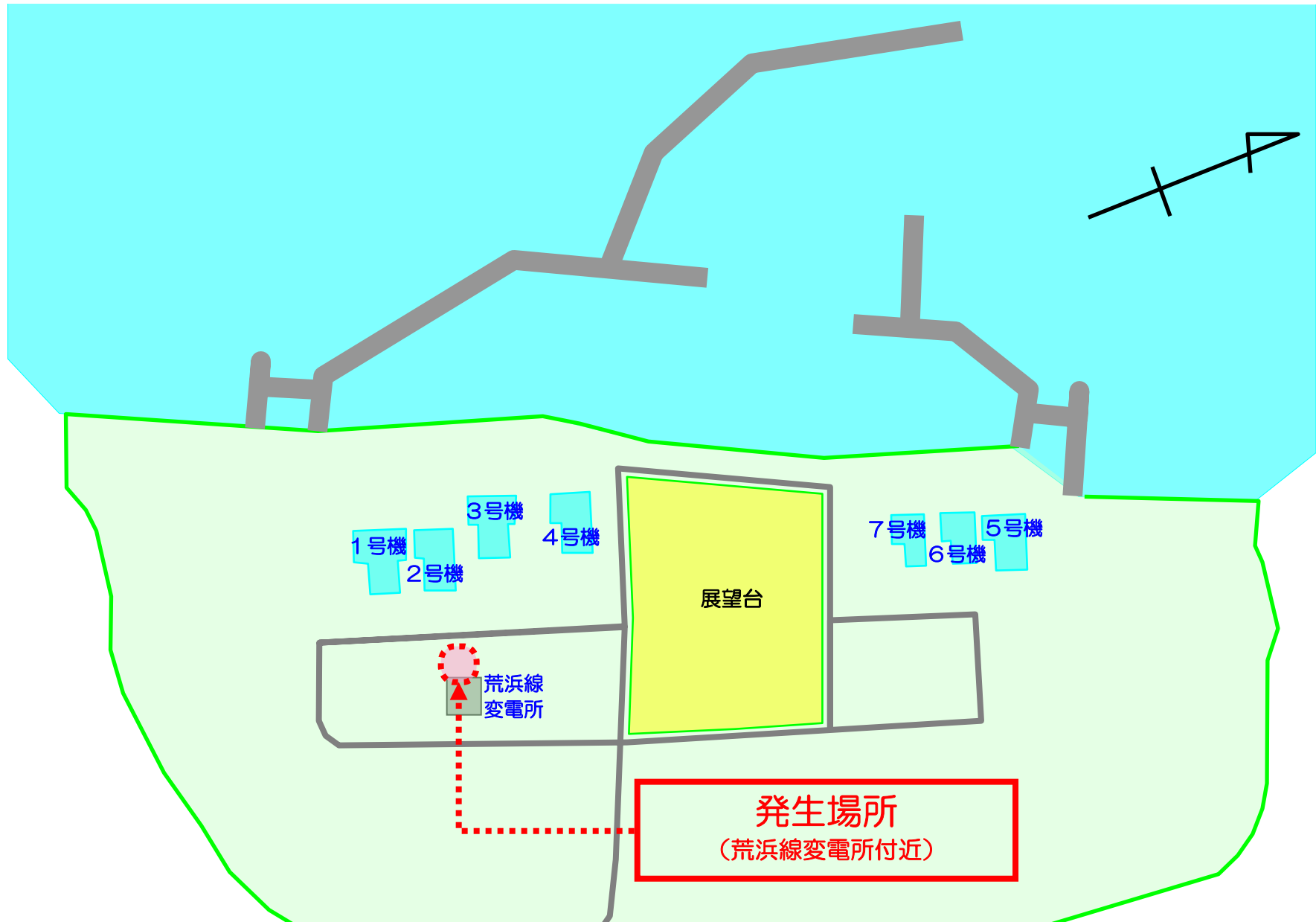
柏崎刈羽原子力発電所 屋外