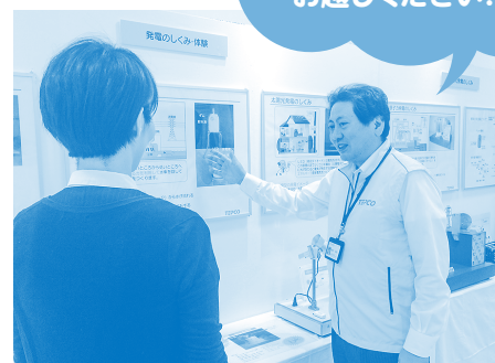
『東京電力コミュニケーションブース』開催風景