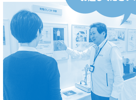
『東京電力コミュニケーションブース』開催風景