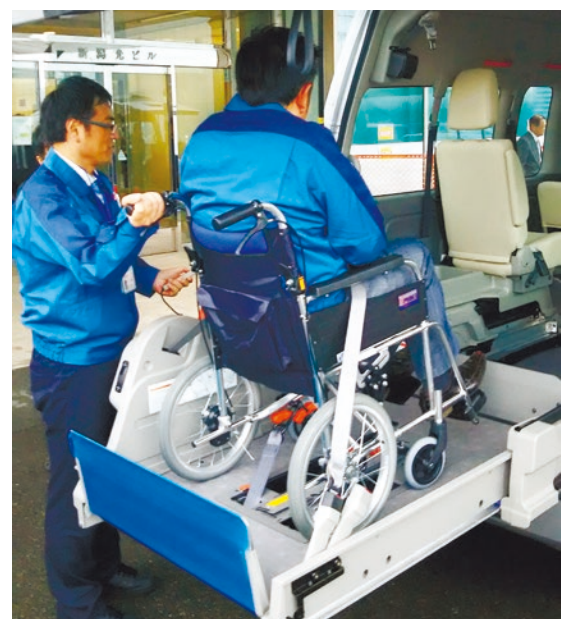
【介護技術研修の様子】

具体的には、地域の住民の皆さまの避難にあたり、当社社員の各自治体への派遣や、介護を必要とされる方々の避難支援、福祉施設や病院・避難経路等々の運営支援、放射線の知識を持つ当社社員による放射線測定など、様々な対応を検討しており、介護を必要とされる方々の避難支援に必要な知識や技術を習得するための研修も行っています。