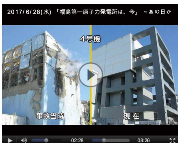
【廃炉作業の進捗をご説明する動画】