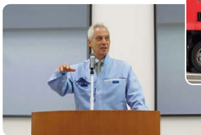
駐日米国大使による所員への訓話