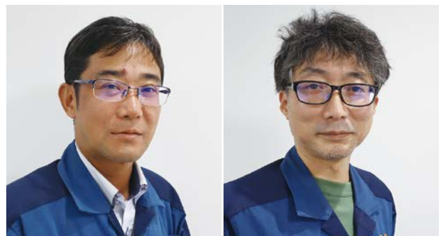
東京電力ホールディングス株式会社 柏崎刈羽原子力発電所 総務部 資材グループ