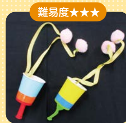
ポンポンクラッカー