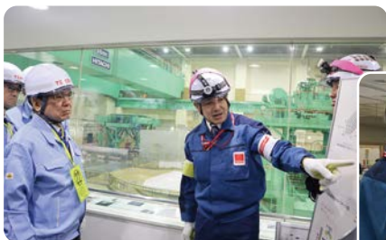
7号機原子炉建屋の視察 (日本経済団体連合会の皆さま)