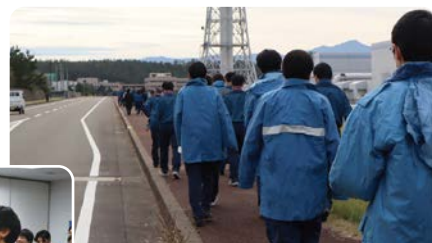
構内健康ウォーク