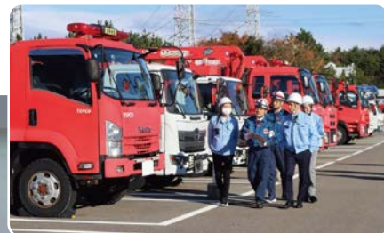
安全対策の視察(駐日米国大使)

11月21日、ラーム・エマニュエル駐日米国大使、日本経済団体連合会の皆さまが発電所をご視察されました。米国大使からは、所員に対して「地元の支持を得て、将来の原子力に繋げてほしい」といった訓話をいただきました。ご視察後には、大使から「福島第一原子力発電所事故の教訓をしっかりと学び活かされていると感じた」というお言葉も頂戴しました。