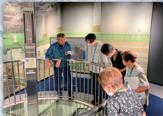
展示館で原子力発電のしくみを説明