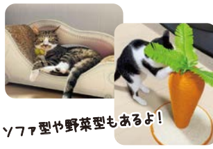
ソファ型や野菜型もあるよ!

我が家の猫は、爪とぎグッズを沢山置いているので、壁や床では爪とぎをしません。面白い爪とぎグッズを知っている方がいたら、ぜひ情報をお待ちしております!(西)