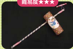
ペーパーロケット

7月30日(土)・31日(日)に行ったイベントでは、たくさんの方にご来場いただきました。