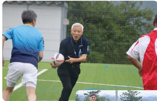
ラグビーは楽しい！

私は高校時代からラグビーにはまりました。先日は、所員のラグビー仲間と共に刈羽村にてタッチラグビーを楽しみ、久しぶりに全身を動かし、笑い合う良い時間が過ごせ