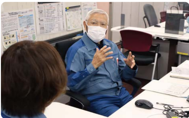
活発なコミュニケーションを目指しています！

挨拶はコミュニケーションの原点であり、同僚の顔を見て、声をかけ合うことで、お互いの心が通じ合うと思っています。浜岡原子力発電所でもトラブルが続いた時に救ってくれたのは挨拶運動でした。業務上でも、何かが違うと思った時に、コミュニケーションが取れていれば気軽に声がかかけられ、それがトラブルの防止にも繋がります。