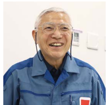
東京電力ホールディングス株式会社 原子力・立地本部 柏崎刈羽原子力発電所長補佐