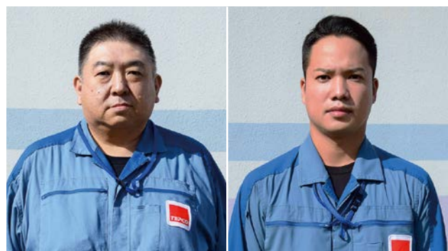
東京電力ホールディングス株式会社 柏崎刈羽原子力発電所 原子力安全センター 防災安全部 防護管理グループ

刈羽村出身。刈羽村在住。2003年入社。 「趣味はドライブです。柏崎港で夜釣りをしながら眺める発電所の夜景がお気に入りの景色です。以前は地元のイベントの実行委員や地元消防団として活動していました。今後も機会があれば積極的に地域の行事に参加していきたいです。」