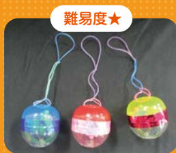
カプセルヨーヨー