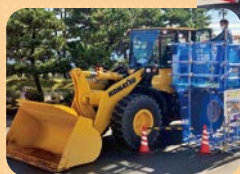
はたらく車乗車体験の様子