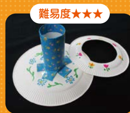
リサイクル輪投げ

10月23日(土)・24日(日)に開催したイベント「エコロンの森にあつまれ!」では、ハロウィンイベントということもあり、仮装したお子さんなどたくさんの方で賑わいました。ご来場ありがとうございました!