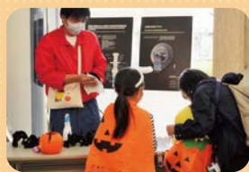
ハロウィンイベントの様子

10月23日(土)・24日(日)に開催したイベント「エコロンの森にあつまれ!」では、ハロウィンイベントということもあり、仮装したお子さんなどたくさんの方で賑わいました。ご来場ありがとうございました!