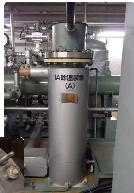
IAドライヤ電気ヒータ