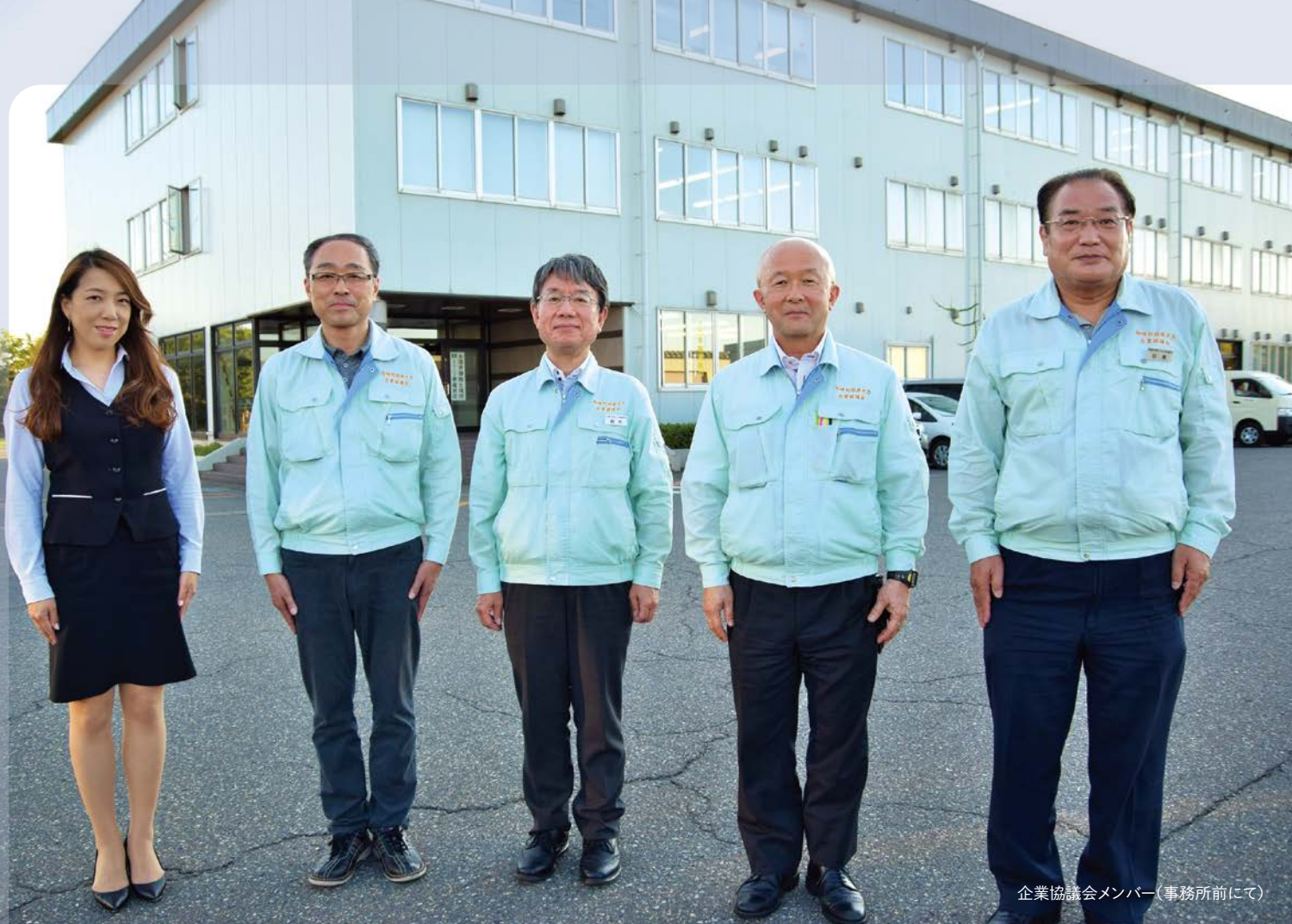
企業協議会メンバー(事務所前にて)