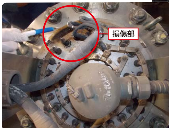
電気ヒータの損傷部