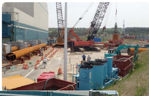
地盤の造成工事（2016年5月 7号機建物脇）

*ガスタービン発電機は、軽油を燃やした燃焼ガスの力でタービン（羽根車）を回すことで発電します。