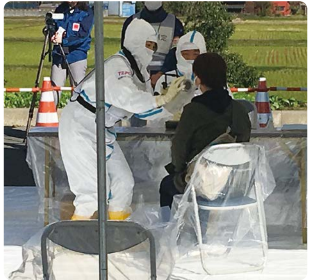
避難者の汚染検査(スクリーニング)の訓練を実施しているところ

地域共創部は、地域共創グループと避難支援グループの二つから成り立っています。地域共創グループは、地域貢献の取り組みについて推進する組織として新たに設置しました。避難支援グループは、原子力災害時の地域の皆さまへの支援に関する活動計画の立案および運営に関わる業務を行っています。私たちは原子力事業を担っています。柏崎市・刈羽村にお住まいの皆さまにご心配をおかけすることのないように様々な対策に取り組んでいます。原子力災害が起きたときには、地域の皆さまがより安全に、確実に、速やかに避難できるようにしなければなりません。例えば、柏崎刈羽原子力発電所で事故が起きた場合、5km圏内にお住まいの体の不自由な方々、病院や福祉施設などに入所している方々が確実に避難できるようにお力添えすることは、私たち原子力事業者としての