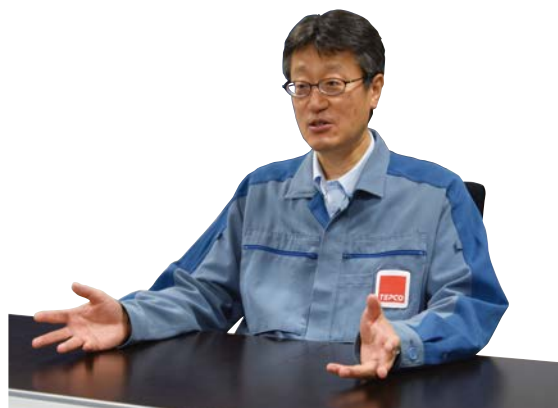
東京電力ホールディングス株式会社 新潟本部 地域共創部長