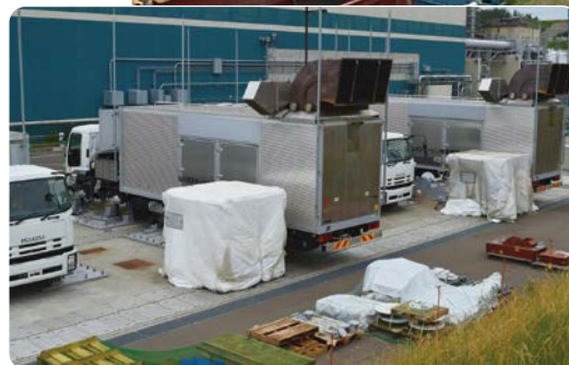
ガスタービン発電機の設置状況 （2020年6月 7号機建物脇）