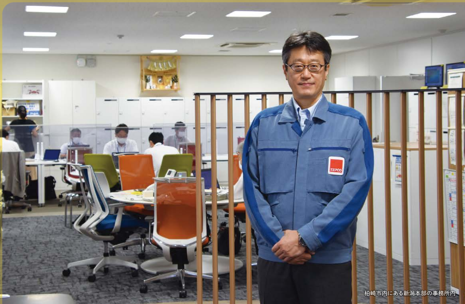
柏崎市内にある新潟本部の事務所内