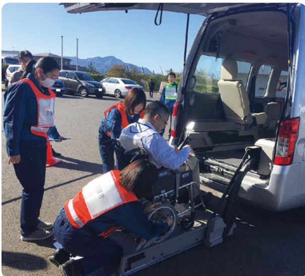
福祉車両による要配慮者の避難支援の訓練を実施しているところ

昨年は、柏崎刈羽原子力発電所の誘致決議から50年の年でした。半世紀以上の長きにわたり、お世話になっている地域の皆さまに感謝いたします。これからも皆さまのご意見やご不安の声をしっかりと受け止め、地域に根差した会社として試行錯誤しながら、お役に立てることを探してまいります。