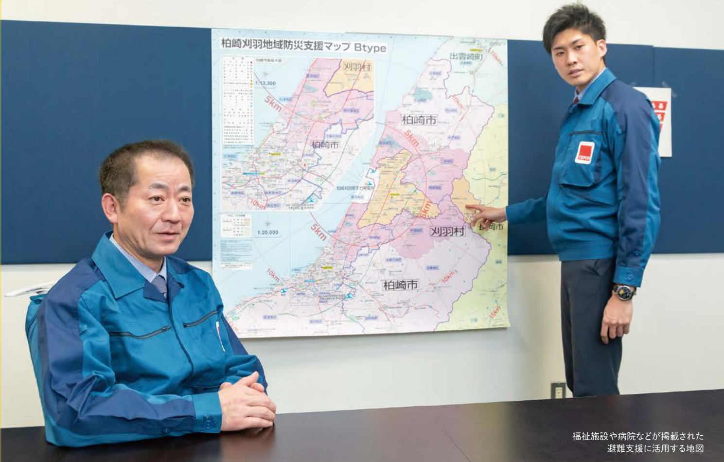
福祉施設や病院などが掲載された 避難支援に活用する地図