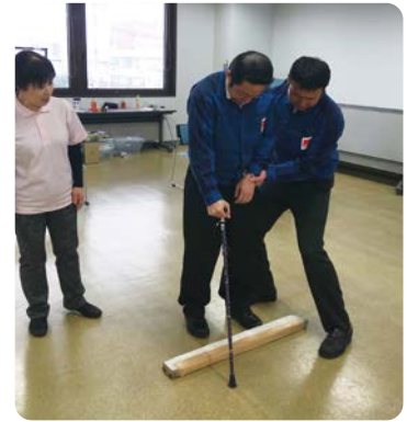
要配慮者を想定した補助訓練