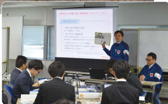
発電所立地の経緯や広報活動に関する研修