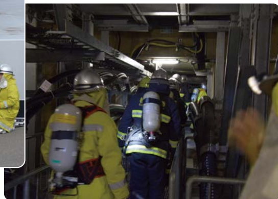
洞道内で火元を捜索する自衛消防隊と柏崎市消防署の隊員