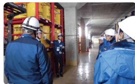
放射性廃棄物の管理に関する説明