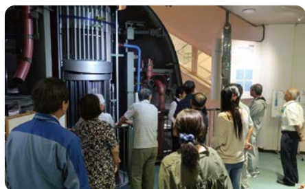
展示館で原子力発電のしくみを説明