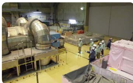
タービン建屋内をご視察