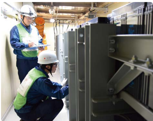
事故の教訓を踏まえて追加で配備したバッテリーの点検

島第一の事故では、津波の影響により直流電源も失いました。その教訓として、外部からの交流電源が受電できなくなり、非常用のディーゼル発電機からの給電もできなくなったときの備えとして、非常用の直流電源設備の容量増加、津波の影響を受けない場所への追加配備などの工事を行っています。