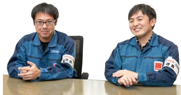
東京電力ホールディングス株式会社 柏崎刈羽原子力発電所 第二保全部 電気機器グループ