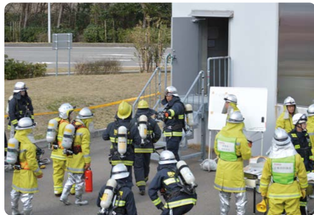
火災発生場所の洞道内へ入る自衛消防隊と柏崎市消防署の隊員