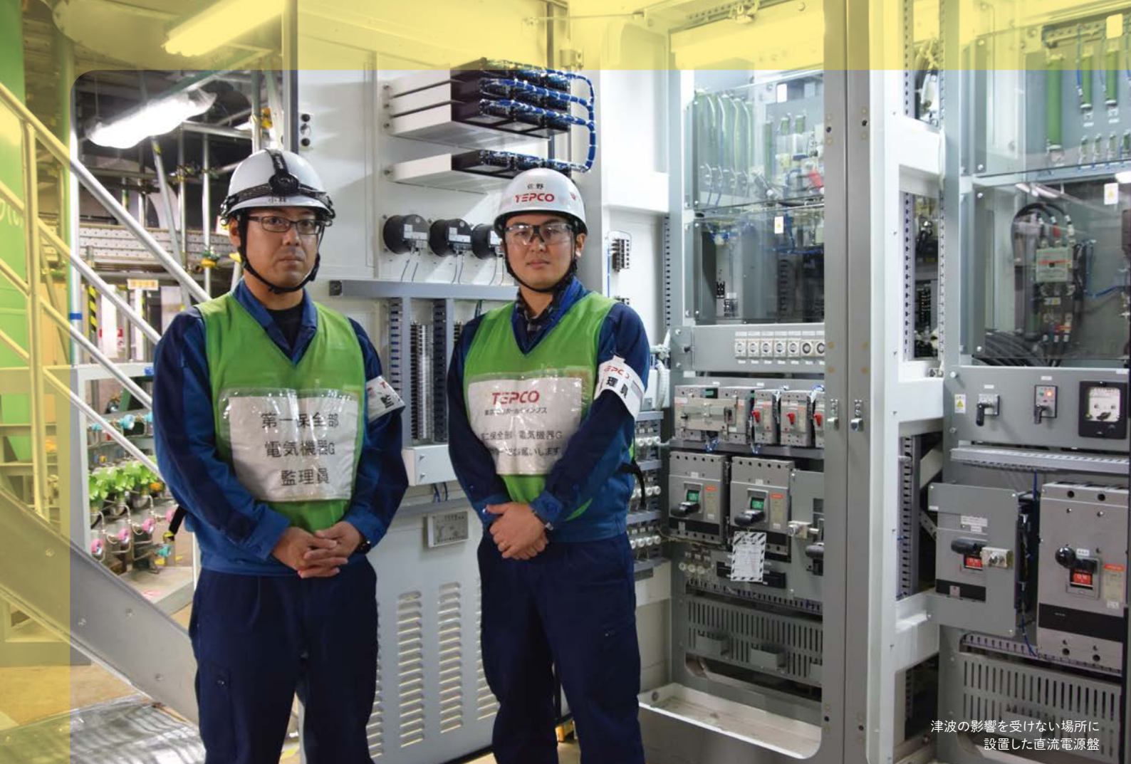
津波の影響を受けない場所に設置した直流電源盤