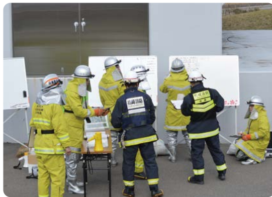
指揮本部で情報を共有