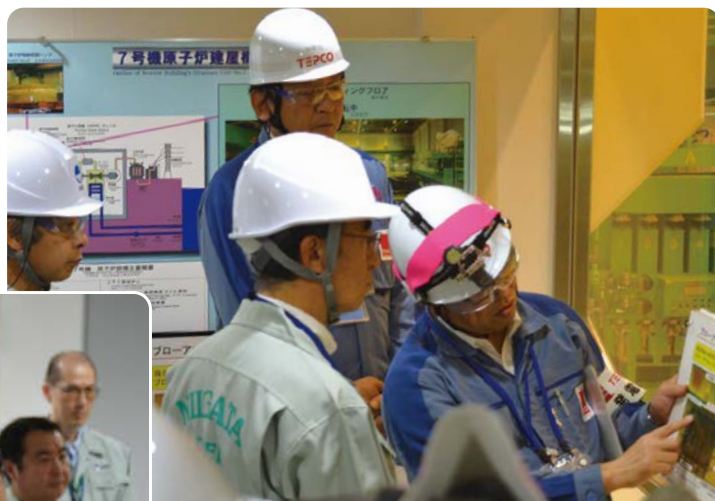
原子炉の構造などに関して発電所長からの説明を聞く花角知事