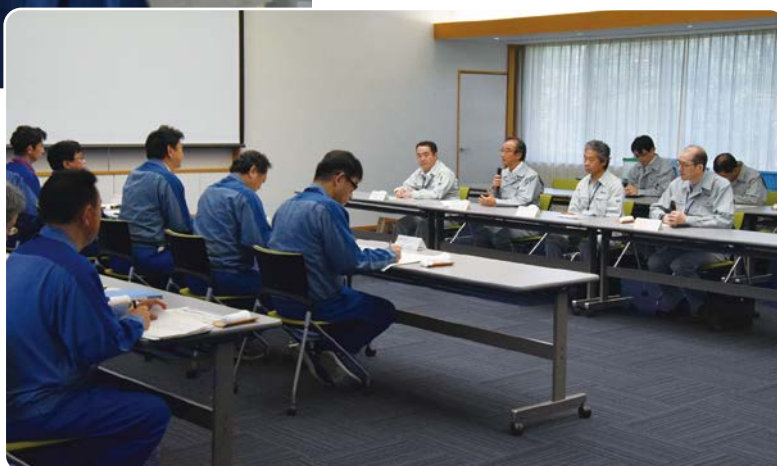
ご視察終了後の質疑応答