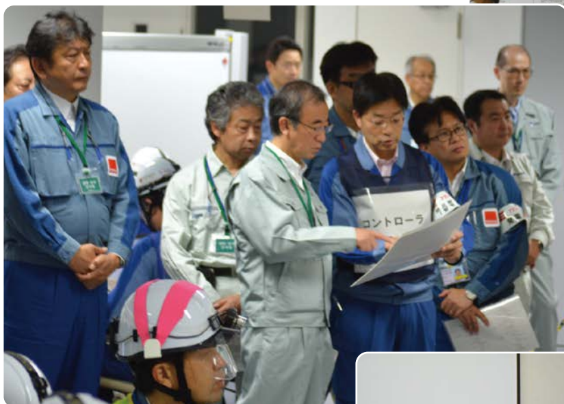
対策本部での訓練をご視察する花角知事(中央)