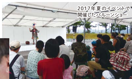
2017年夏のイベントで 開催したバルーンショー

柳 私たちは定期的にご案内の仕方をチェックし合い、レベルアップに努めています。案内業務とイベント企画業務の並行は大変ですが、お客さまの笑顔を見ると「良かった」と思います。小さなおさまに楽しんでいただけるキッズフォレストをオープンしてからは、遠方からファミリーのお客さまの来館が増えました。私自身、中学生の時、理科の先生に発電所のことを理解する機会を与えてもらいま