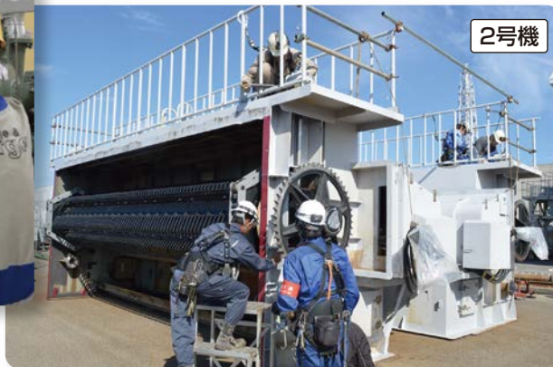
冷却水として使用する海水の中のゴミや海草などを取り除く機器の点検