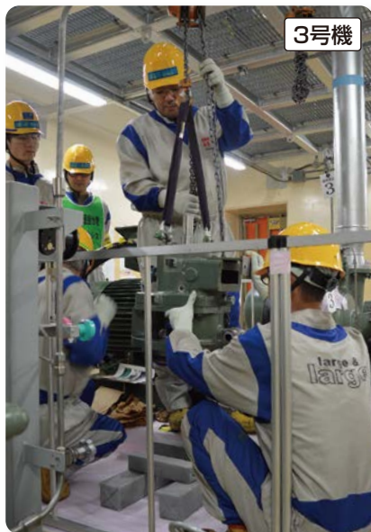
原子炉建屋内にある機器へ水を補給するポンプの点検

発電所では、各々の機器の点検計画を作成し、その計画に基づいた作業を行っています。また、原子炉内の燃料は全て取り出し、使用済燃料貯蔵プールに保管しています。