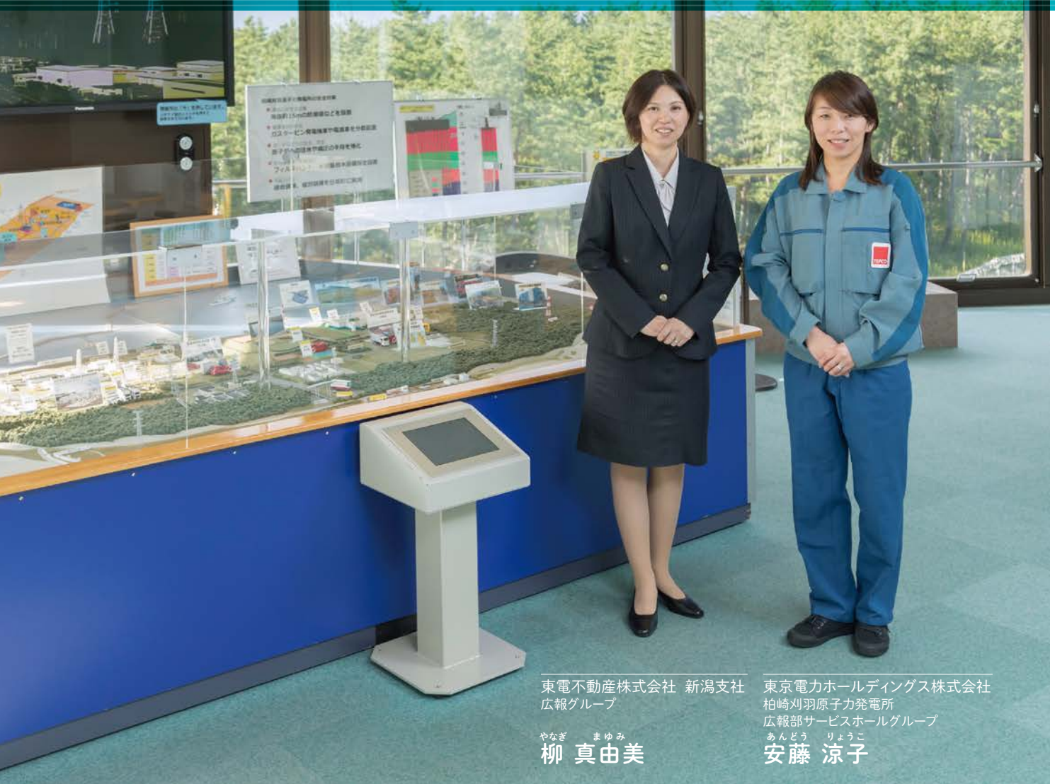
東電不動産株式会社 新潟支社 広報グループ