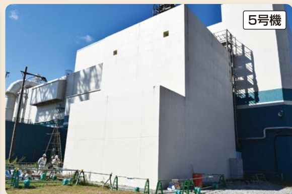
重大な事故に備え、格納容器の破損を防ぐために 設置するフィルタベントの遮へい壁