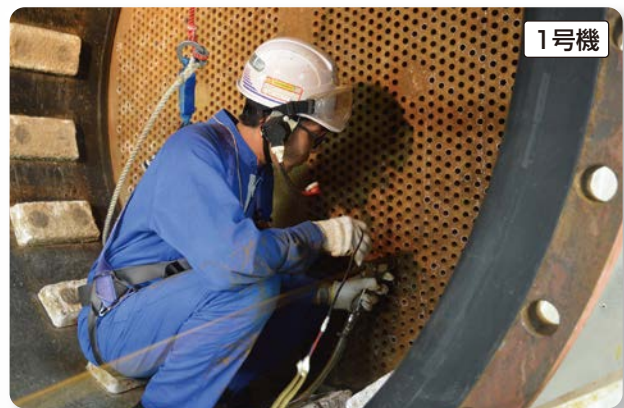
熱交換器伝熱管の探傷検査