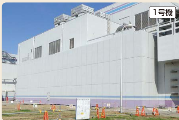
給気口などから原子炉建屋内への水の浸入を防ぐ 海拔高さ約15mの防潮壁