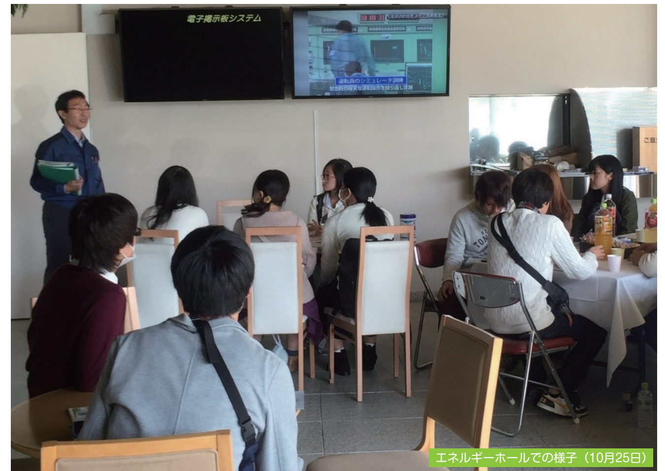
エネルギーホールでの様子 (10月25日)