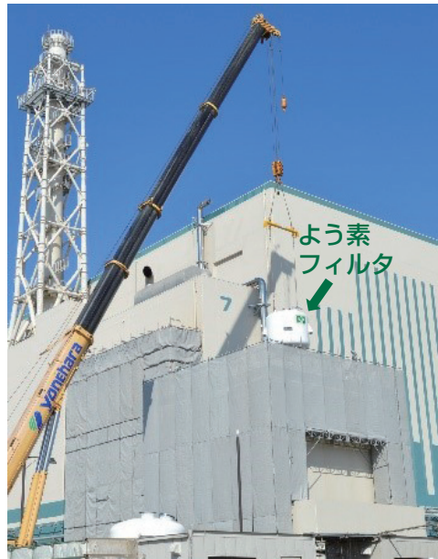
▲フィルタベント設備に吊り込む「よう素フィルタ」 地上式・地下式両方のフィルタベント設備に各2個を設置する計画。(今回は、7号機地上式に2個設置)