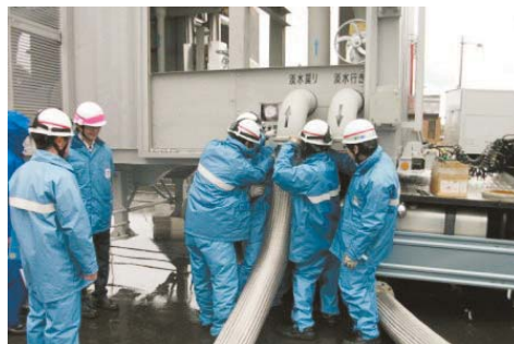
代替海水熱交換器車の接続訓練