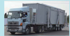
代替海水熱交換器車 (7台配備)