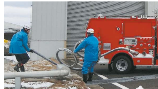
消防車から原子炉へ冷却水送水訓練