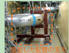
追加した配管の支え

中越沖地震を踏まえ、配管や電線の支えを号機あたり1,400箇所以上追加や強化しています。