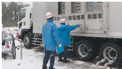
ガスタービン発電機車の操作訓練