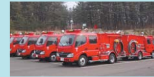
消防車 (42台配備) ※消防用3台含む