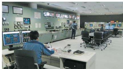
シミュレータによる訓練