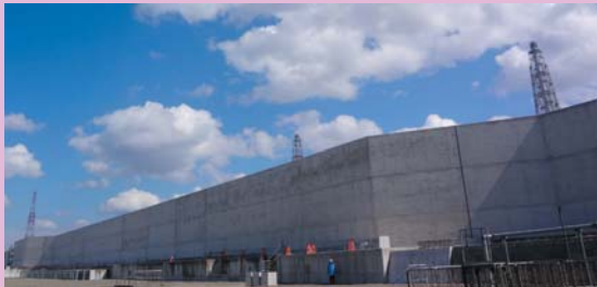
1～4号機側防潮堤(鉄筋コンクリート製)