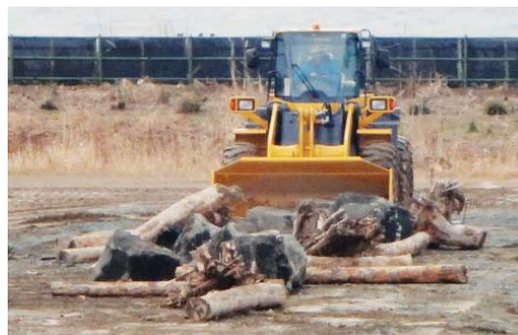
重機によるがれき除去訓練