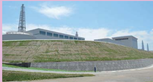
5～7号機側防潮堤(セメント改良土による盛土)

海側に海拔約15mの高さの防潮堤をつくり敷地の浸水を防ぎます。また、建物の周りに防潮壁などをつくり建物への浸水を防ぎ、さらに重要な部屋を防水構造にしています。