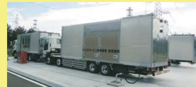
ガスタービン発電機車 (GTG) (3セット配備)