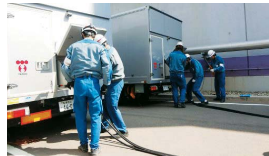
電源車の接続訓練