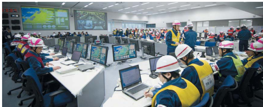
所員数百名が参加する総合訓練

夜間や降雪時など様々な状況における緊急事態を想定し、準備した安全対策設備を所員が使いこなせるように訓練を繰り返し実施しています。