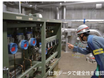
計測データで健全性を確認