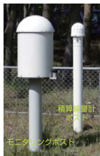
モニタリングポストと積算線量計ポスト