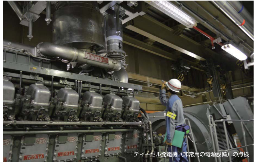
ディーゼル発電機（非常用の電源設備）の点検