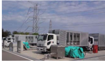
緊急時用車両置き場