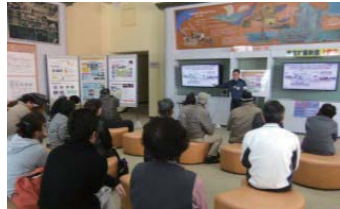
サービスホール説明会

【お問い合わせ】 サービスホール ☎ 0120-34-4053（9:00～17:00）