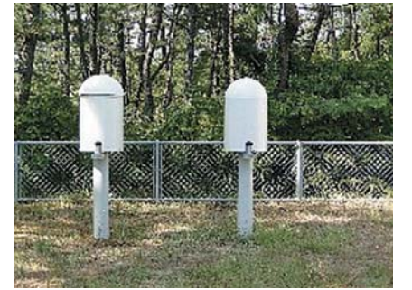
モニタリングポスト

※私たちの身の回りには、自然放射性物質（ウラン・トリウム系列の放射性物質やカリウム40など）からの自然放射線が存在します。