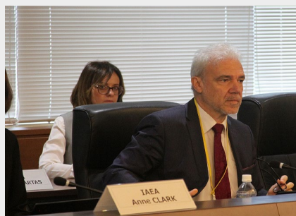
리뷰 미션의 오프닝 세션에 참가한 카루소 조정관 (2024년 4월 23일 외무성)