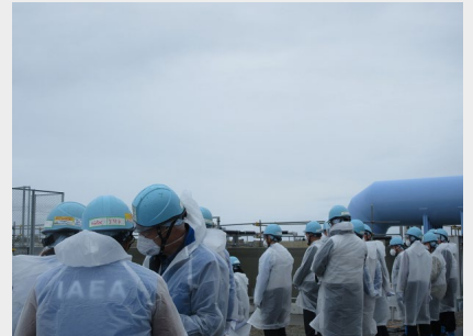
희석 설비를 시찰하는 IAEA 태스크포스 (2024년 4월 25일 후쿠시마 제1원자력발전소)

※1 IAEA 태스크포스 중 6명의 IAEA 직원과 9명의 국제 전문가가 방일 (아르헨티나, 영국, 호주, 한국, 중국, 프랑스, 베트남, 미국, 러시아)