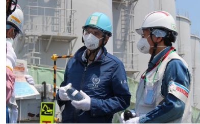
IAEA의 그로시 사무국장의 ALPS 처리수 관련 설비 시찰(2022년 5월)