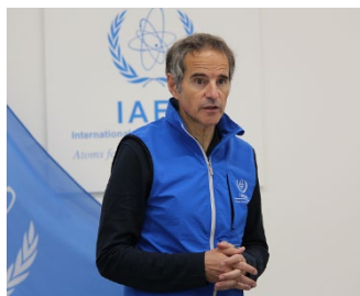
그로시 IAEA 사무총장

‘태스크포스는 도쿄전력과 원자력규제위원회의 활동이 관련 국제 안전 기준에 부합하는지의 여부를 평가하기 위해 앞으로도 지속적으로 리뷰를 실시하겠다.’ 고 밝혔으며 다음 리뷰 미션은 2024년 10월 ~ 12월에 실시될 예정입니다.