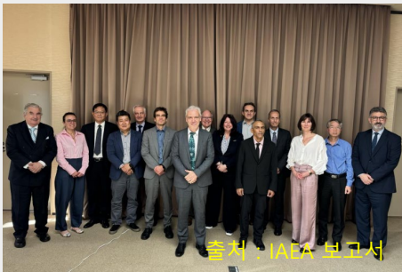
일본을 방문한 IAEA 태스크포스 (2024년 4월 23일 경제산업성)