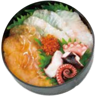
ふくしま常磐もの二種丼 1,280円

福島を代表する魚ヒラメを生と醤油漬け2つの味で。常磐ものヤナギダコも盛り込んだ上品な海鮮丼