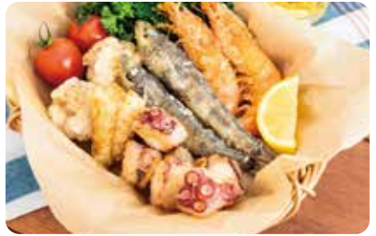
「常磐もの」を使った惣菜も一部店舗にて販売!