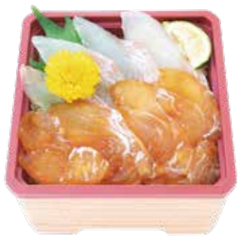
常磐ものヒラメニ色丼 880円