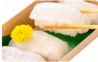
「常磐もの」の魚を使ったお寿司や限定メニューも登場!