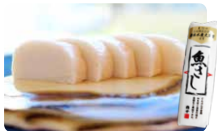
農林水産大臣賞を受賞したかまぼこ「魚さし」や、さつま揚げなどの加工品