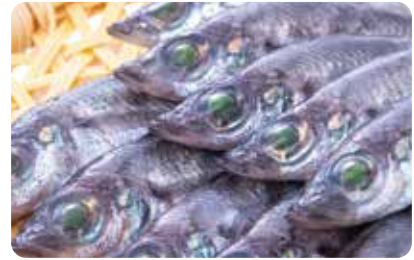
ふくしまを代表するヒラメやメヒカリをはじめ、「常磐もの」鮮魚が大集合!