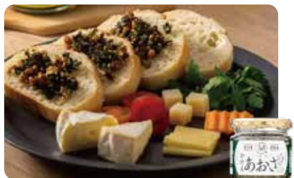
相馬市松川浦のあおさを使った加工品もラインナップ