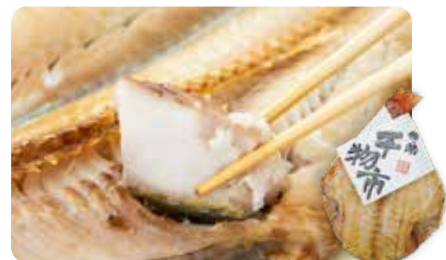
いわき市小名浜の老舗干物専門店「伴助」の干物をラインナップ