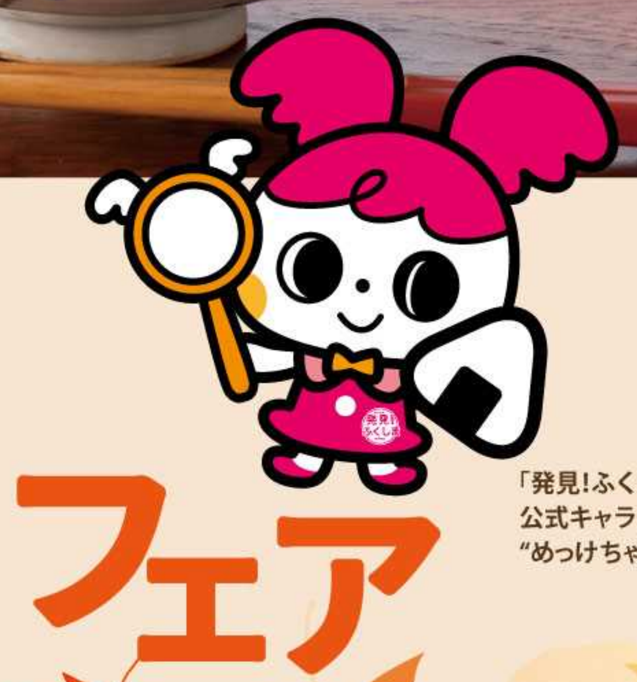
「発見!ふくしま」 公式キャラクター 「めっちゃん」