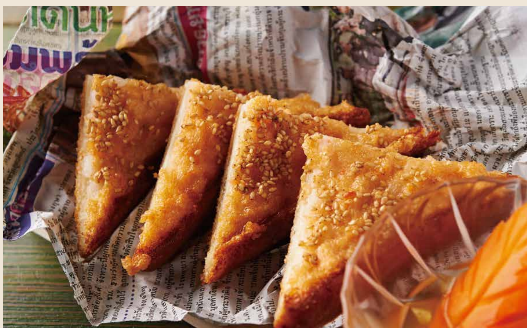
タイ風海老トースト 常磐ものと北海道産ホタテすり身乗せ 700 円