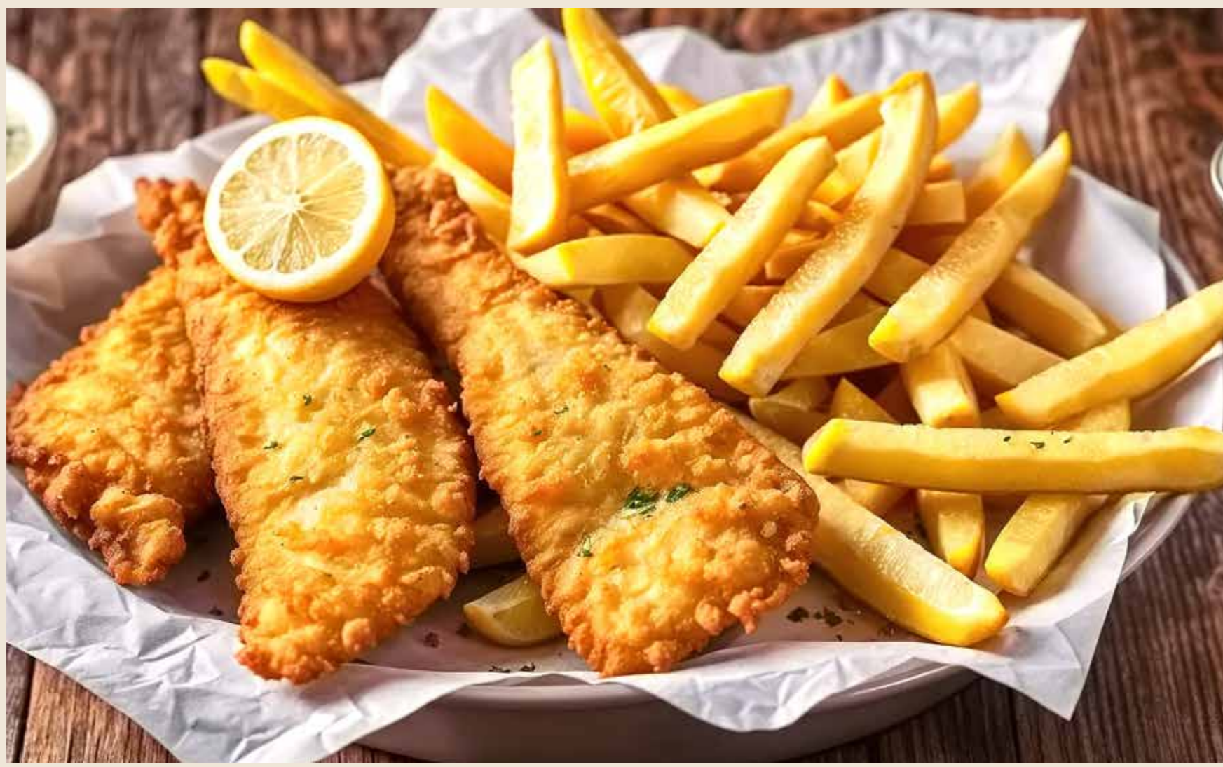
タイ風フィッシュアンドチップス マヨネーズ & スイートチリソース 750 円