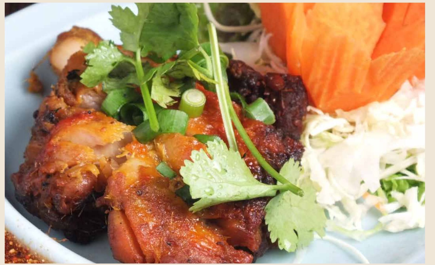
伊達鶏のガイヤーン 600 円