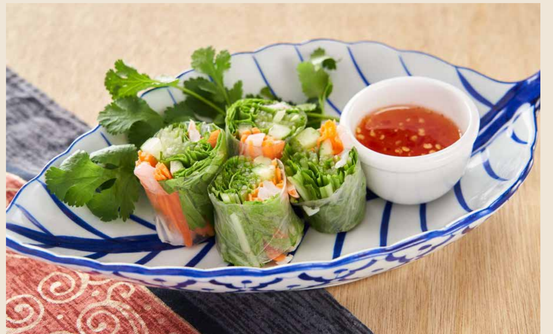
常磐ものと北海道産ホタテの 海鮮生春巻き 700 円