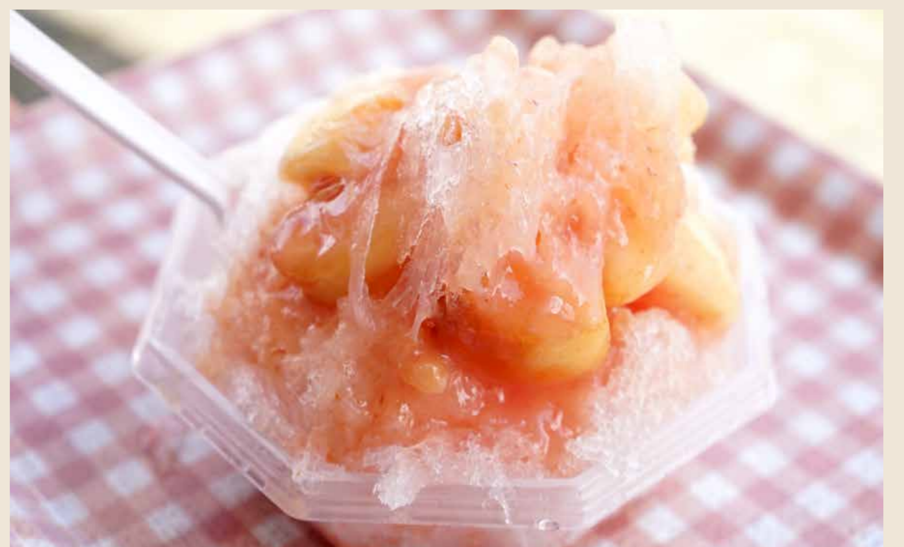
ふくしまの桃のかき氷 800 円