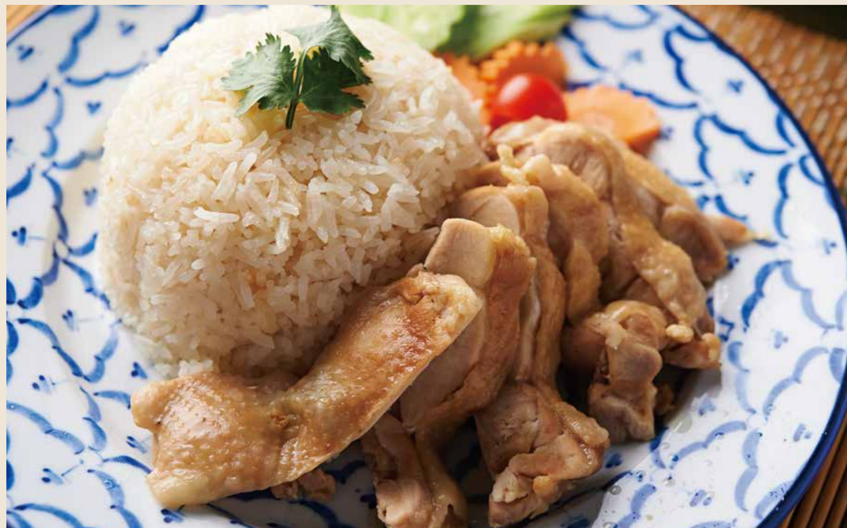
伊達鶏のカオマンガイ 900 円 ハーフ 500 円