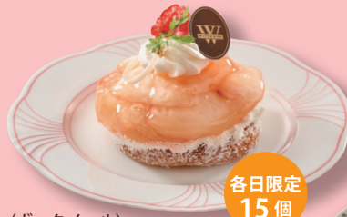
〈ヴィタメール〉 福島桃使用タルト・オ・ペッシュ (1個) 712円 本館地下2階=和洋菓子売場