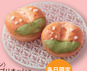
〈ルビアン〉 福島桃のプリオッシュ (1個) 345円 本館地下2階=パン売場