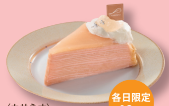
〈カサネオ〉 福島桃のミルクレープ (1個) 702円 本館地下2階=和洋菓子売場