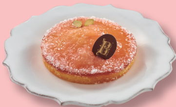
〈ビスキュイテリエ・ブルトンヌ〉 ガトー・ナンテ [福島桃] (1個) 410円 本館地下2階=和洋菓子売場