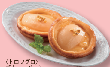
〈トロワグロ〉 ガトー・ペーシュ (1個) 302円 本館地下2階=トロワグロ