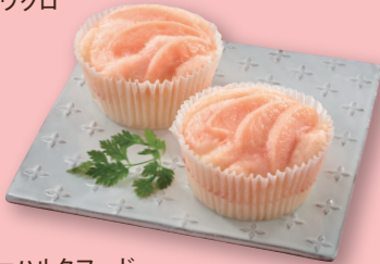
〈ボンパドウル〉 桃の蒸しパン (1個) 172円 ハルク地下2階=ハルクフード