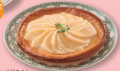
〈ボンパドウル〉 プリオッシュタルトピーチ (直径約18cm) 756円 ハルク地下2階=ハルクフード