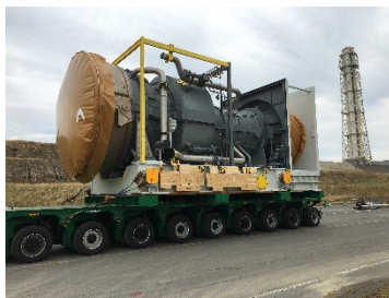
新しいガスタービン車室の構内運搬