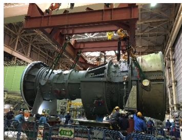
新しいガスタービンロータの吊り上げ作業