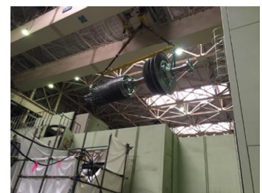
新しいガスタービンローターの吊り上げ作業

※火力発電所の燃料費削減を目的とした設備対策につきましては、ホームページでも解説しています。