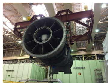
新しいガスタービン車室の吊り上げ作業