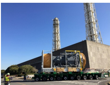
新しいガスタービン車室の運搬作業