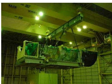
新しいガスタービン車室の吊り上げ作業