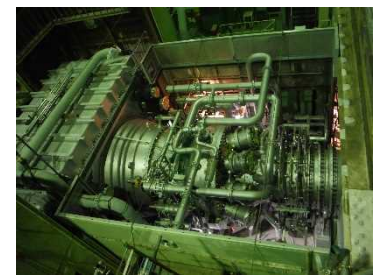
新しいガスタービン設備の据付状況

※火力発電所の燃料費削減を目的とした設備対策につきましては、ホームページでも解説しています。