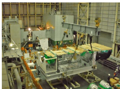
新しいガスタービン設備の吊り上げ作業