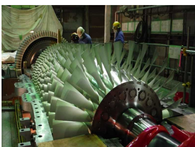
新しいガスタービン設備の組立作業