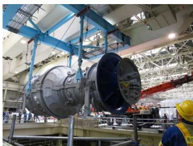
新しいガスタービン設備本体の 吊り上げ作業