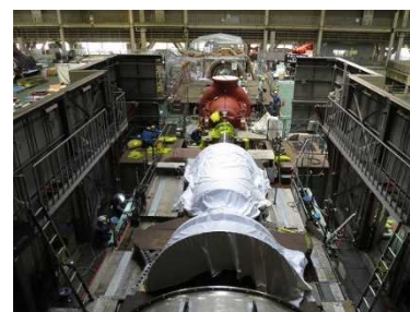
ガスタービン設備 分解作業

※火力発電所の燃料費削減を目的とした設備対策につきましては、ホームページでも解説しています。