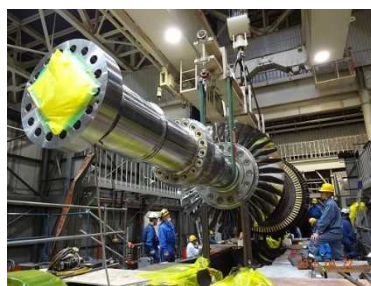
新しいガスタービン設備 (ローター) の吊り込み作業