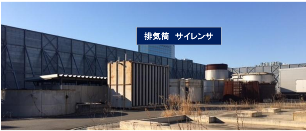
排気筒 サイレンサ