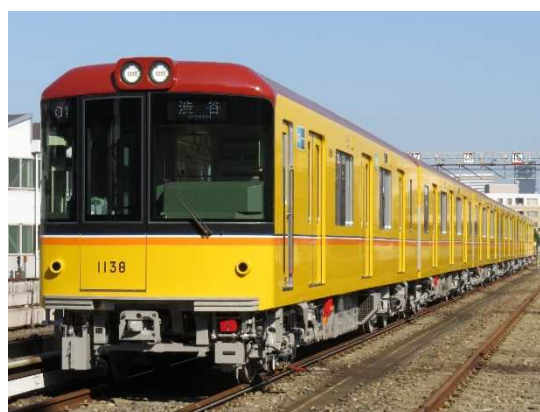
東京メトロ銀座線 1000 系車両