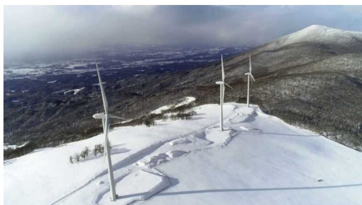
姫神ウィンドパーク