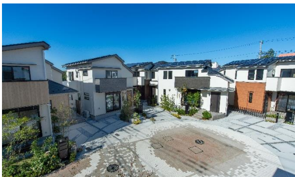
分譲戸建代表物件「リーフィア狛江 蒼翠の街」

今後、その他の新築分譲戸建て計画や既存の戸建てにおいても順次拡大していく見込みです。