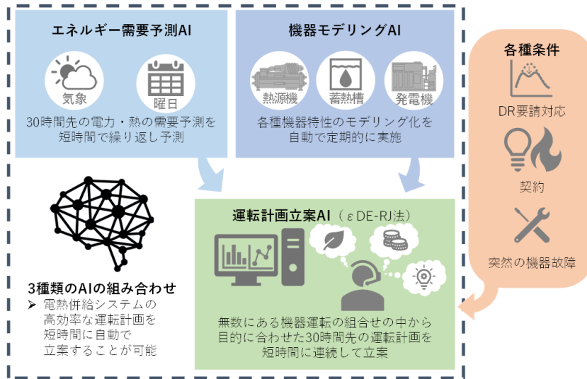
＜エネルギーマネジメントシステムの概念図＞