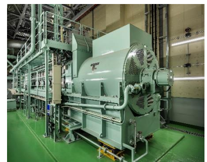
〈大型 CGS〉 ※画像はイメージです

そして、主用となる大型 CGS は高い耐震性能を備えた中圧ガスラインから供給される都市ガスを燃料としており、系統電力停電時にも都市ガスの供給が継続する限り CGS による発電が可能です。災害時の供給先には、地域の防災拠点機能の核となる帰宅困難者のための一時滞在施設といった公益施設も含まれており、近隣エリアを含む街区全体の防災力向上に貢献します。