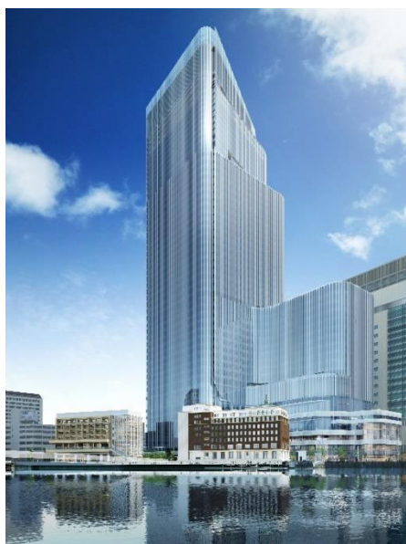
<完成予想外観イメージ(日本橋川から)>