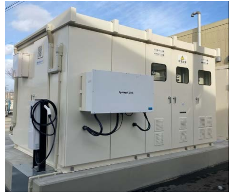
リチウムイオン蓄電池 (136kWh)