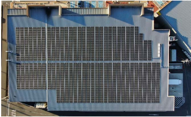
太陽光発電設備 (376kW、上空から撮影)