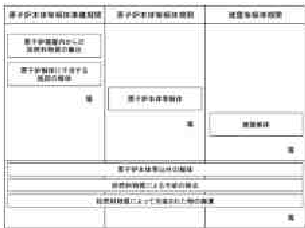
図15-1 想定廃止措置工程

1号発電用原子炉の廃止措置は、「原子炉等規制法」に基づく廃止措置計画の認可以降、原子炉本体等解体準備期間、原子炉本体等解体期間、建物等解体期間を経て、段階的に30～40年程度をかけて廃止措置を進めていく予定であるが、具体的な工程については、廃止措置を開始するまでに検討し、廃止措置計画に記載し、認可を受けるものとする。想定廃止措置工程を図15-1に示す。