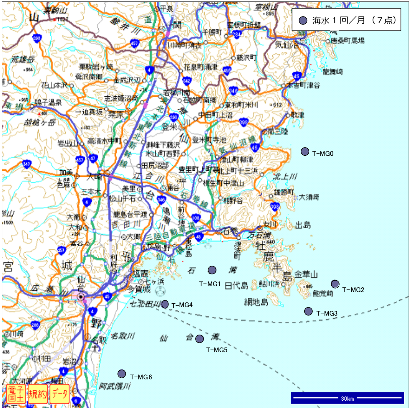
図2. 海水等採取位置（宮城県沿岸）