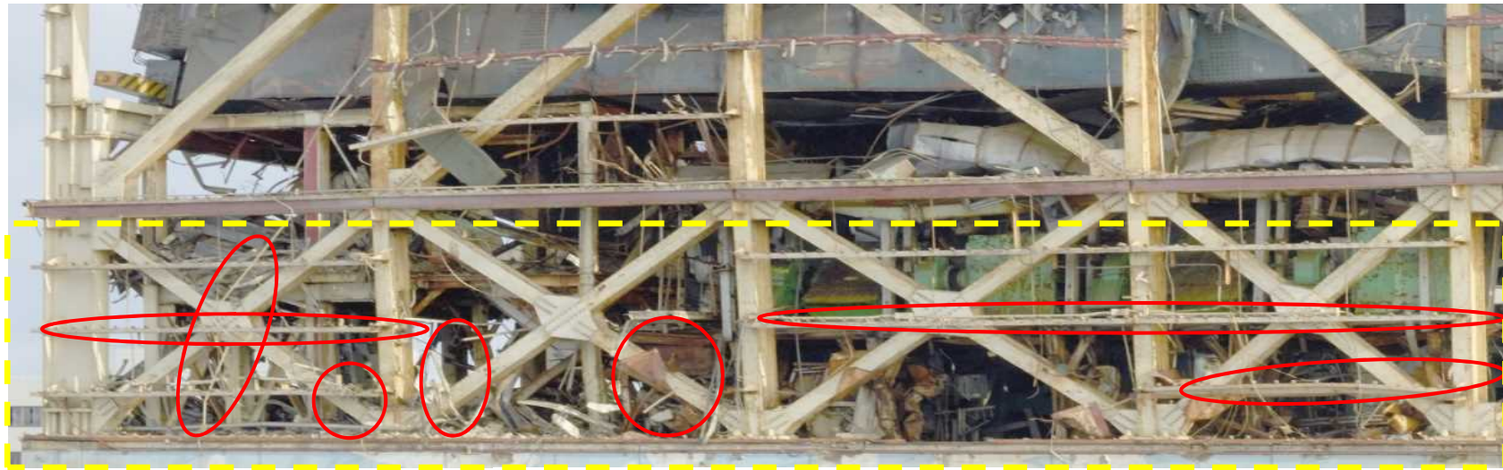
撤去対象（赤丸部分を撤去）