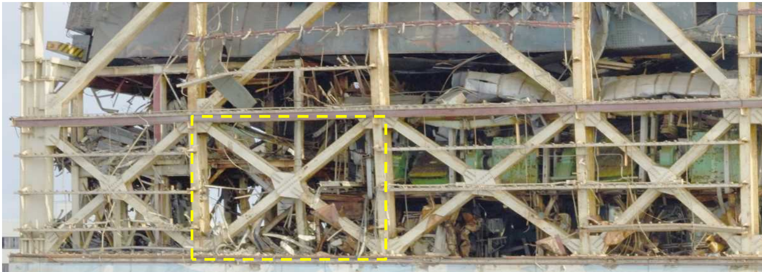
撤去対象（黄色枠部分のはみ出しガレキを撤去）