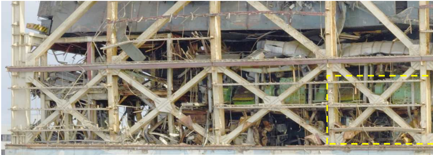
撤去対象（黄色枠部分のはみ出しガレキを撤去）