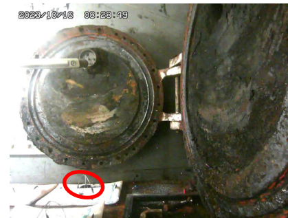
ハッチ開放時に蓋側から落下した 堆積物