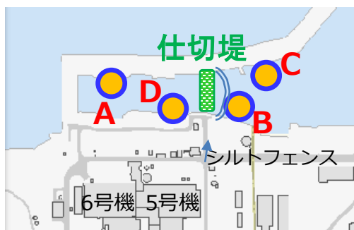
図2.5,6号機取水路開渠の海底土調査位置