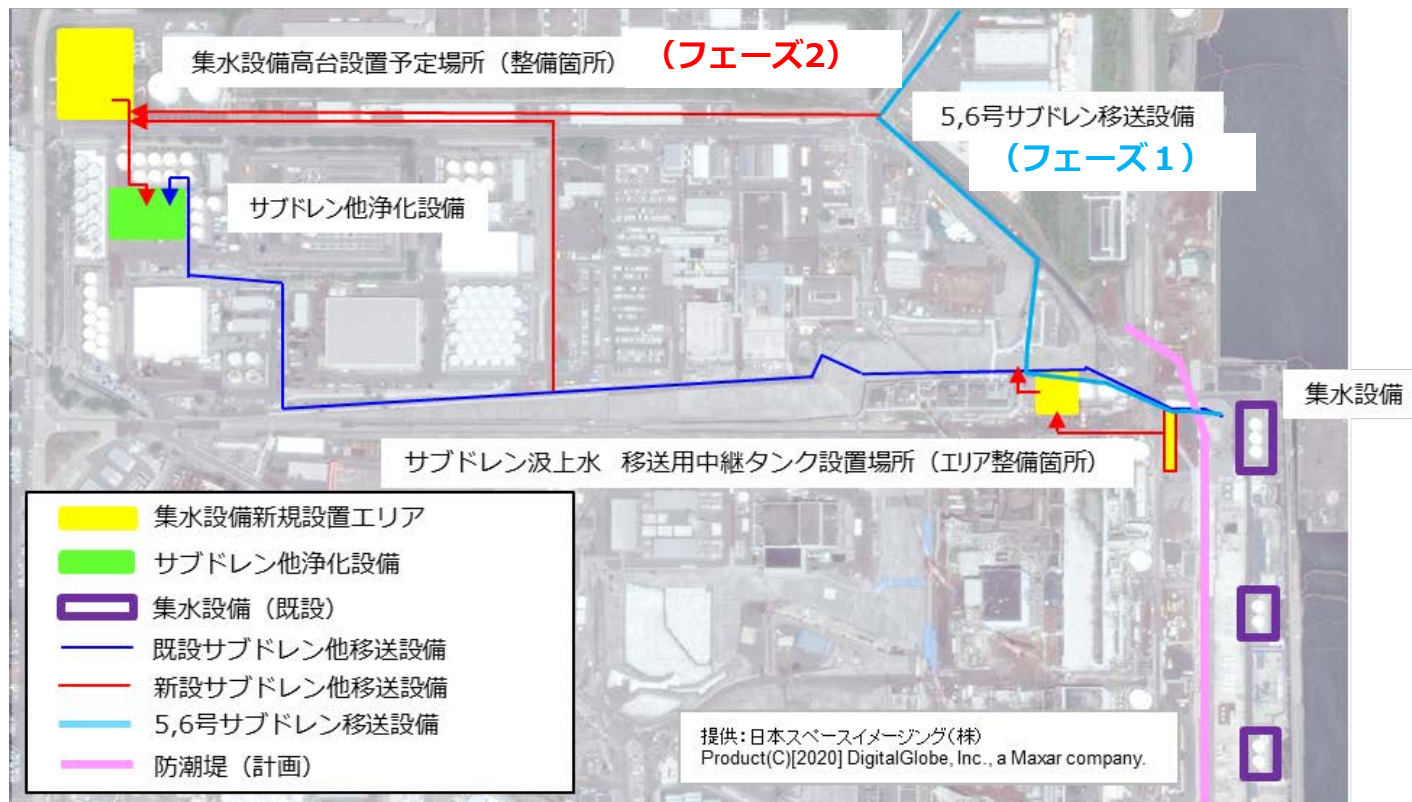
サブドレン移送配管計画図 (案)

既設の1~4号機サブドレン集水設備は、津波対策の一環として、高台へ機能移転を予定しており、5/6号機二次中継タンクを同機能移転に併せて設置し、サブドレンを一括して運用することを計画しています。【設備設置完了目標】2023年度末~2024年度初め