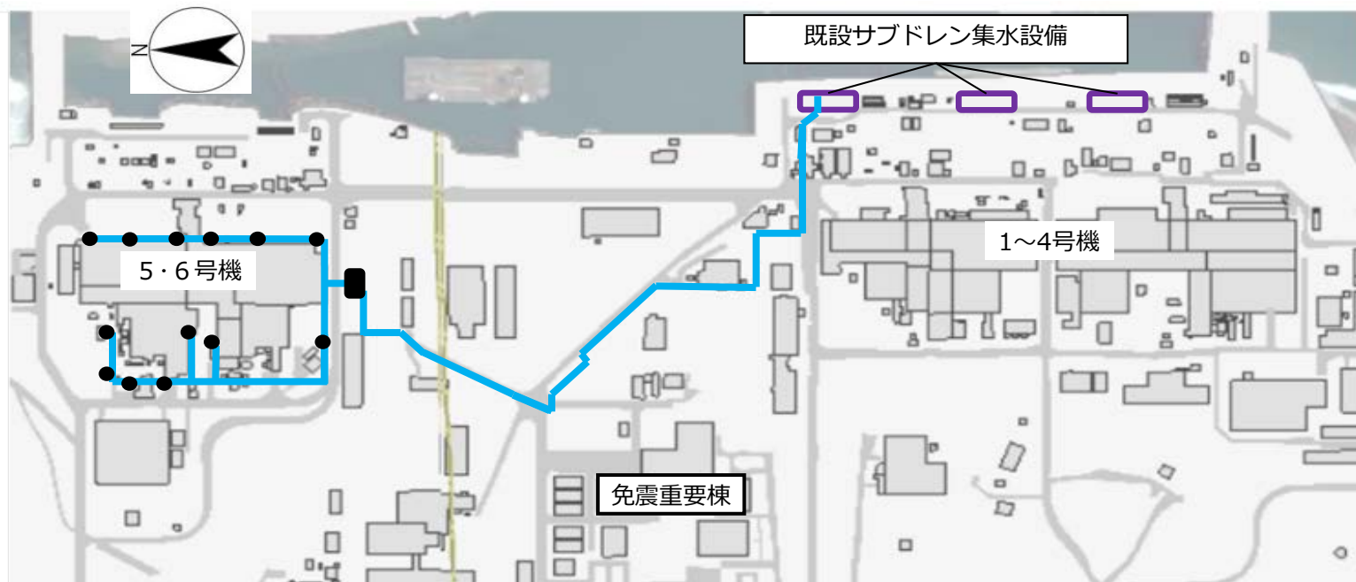
5/6号機サブドレンで汲み上げた地下水移送ライン