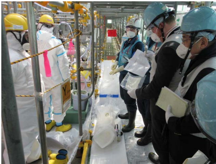
サンプル採取立ち会いの様子