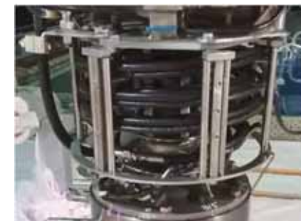
マスト周りの ホース・ケーブル類